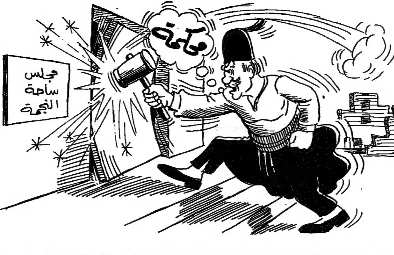
صريح قاس التواب على قانون حالة الرؤساء والوزراء